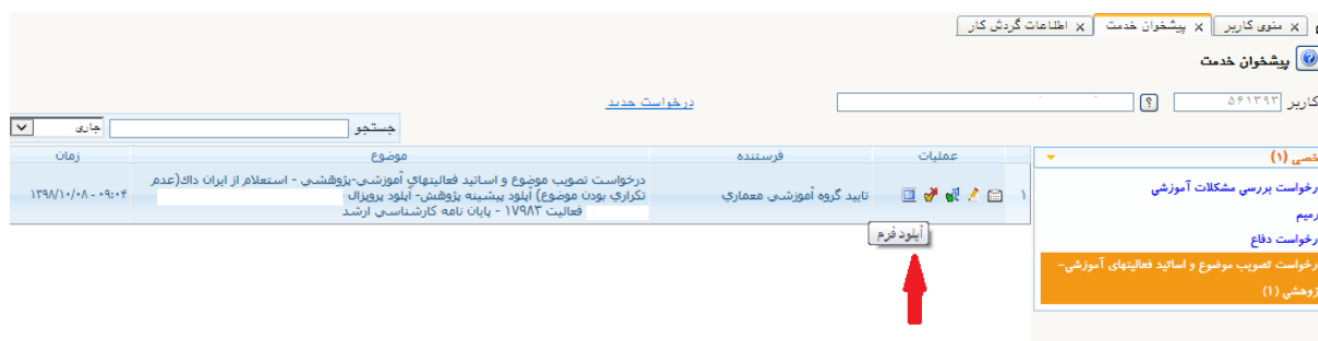
(شکل شماره ۵)

توجه ۲: در صورتی که گروه نیاز به فرم تک برگ و فرم پیشینه پژوهش دارد قبل از تایید و ارسال از قسمت آیکون آپلود تک برگ، پیشینه پژوهش (گواهی عدم تکراری بودن موضوع ار سایت ایران داک https://pishneh.irandoc.ac.ir ) ، فایل ها آپلود گردد. (شکل ۵).