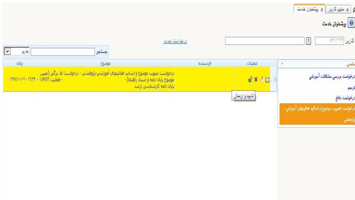
(شکل شماره ۴)

بعد از تکمیل درخواست در قسمت پایین فرم با کلیک بر روی گزینه ایجاد، درخواست دانشجو ثبت می گردد. و با کلیک بر روی دکمه بازگشت در صفحه پیشخوان خدمت ردیفی (شکل ۴) اضافه می گردد که با کلیک بر روی گزینه تایید، درخواست به استاد راهنما ارسال می گردد.